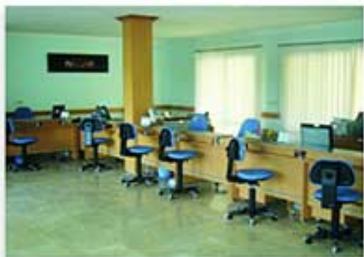
مدل 3011 ابعاد 170x70x110 سانتی‌متر