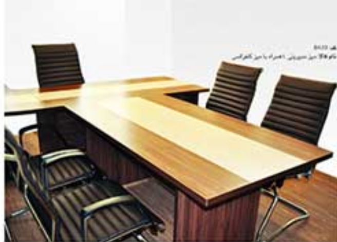
کد 0430 نام T4 میز مدیریتی ابعاد (ش): 110 x 170 x 75