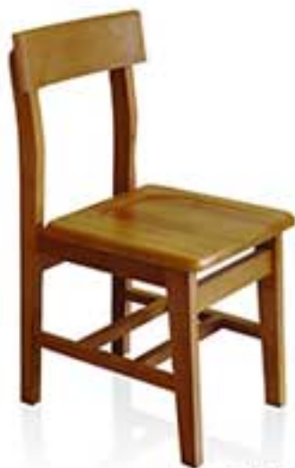
٤٤٥٩-٤٤ نام و نشان معماران: آناه پوری