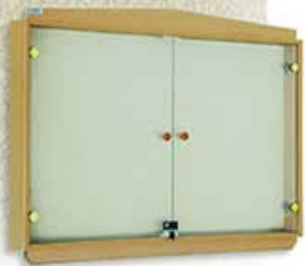
المدخل باب الخزانة ١٠٠٠