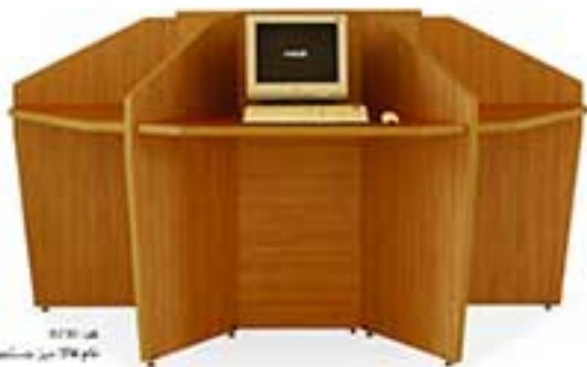
مدل 0120 ابعاد: 110 x 110 x 75