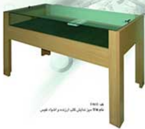
قه 0015 نام 316 مین دینا کله ایزده و انوار قوس