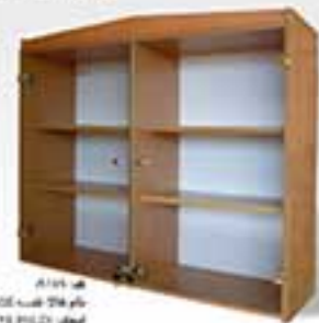
مدل A104 نام طرح کفبه و پانچر به کمره ابعاد: 120x90x40