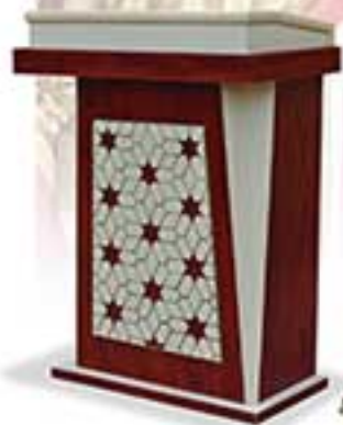
المدخل باب الخزانة ١٠٠٠