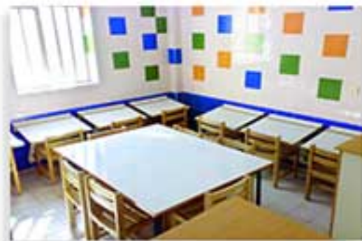
کلاس درس مدرسه ابتدایی