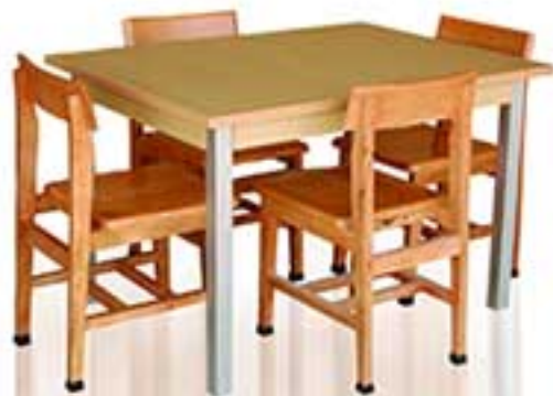
مودل 0112 طاقم 20 من سلاله جوار قمره سلاله الاجناس 130 x 130 x 45 - 2013, 20