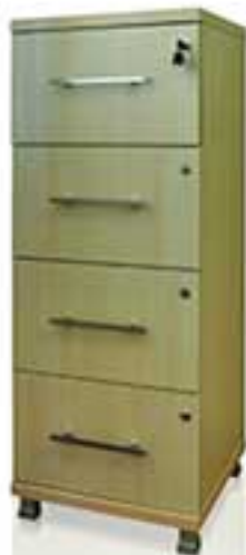
مدل 0001 نام: 5 درایه چرخدار کشو