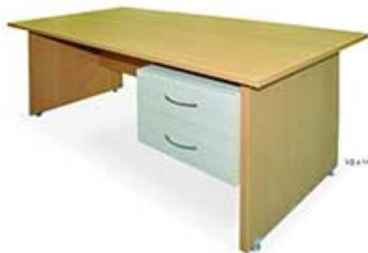
کد 0430 نام T4 میز اداری ابعاد (ش): 110 x 170 x 75