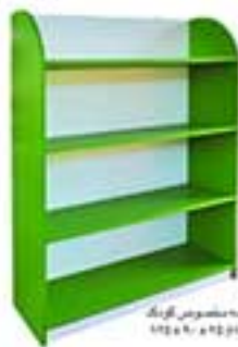
هه ۲۱۲۱ نام ۳۸ من مخصوص کونگ ارتفاع ۲۱۲ - ۹۵ x ۹۵ x ۹۵