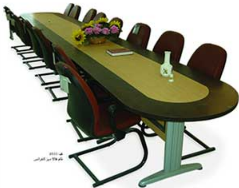
مدل ۳۱۱۰ بوم ۳۱۸ مدیر کنفرانس