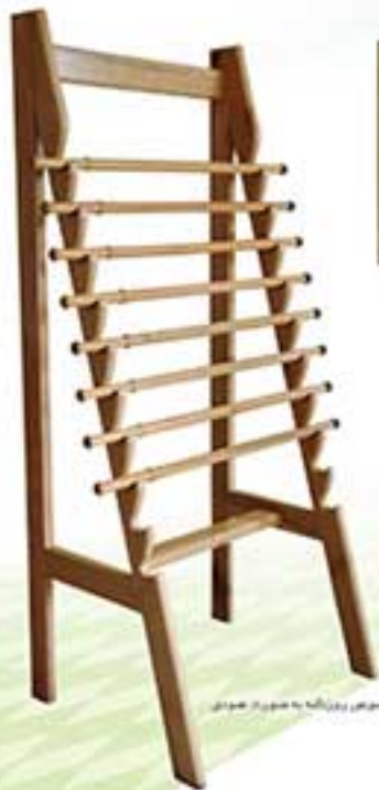
قه 0017 نام 316 مین مخصوص دینا کله به صورتی خودی