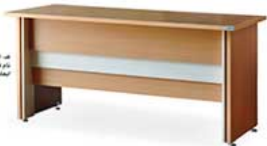
کد 0430 نام T4 میز اداری ابعاد (ش): 110 x 170 x 75