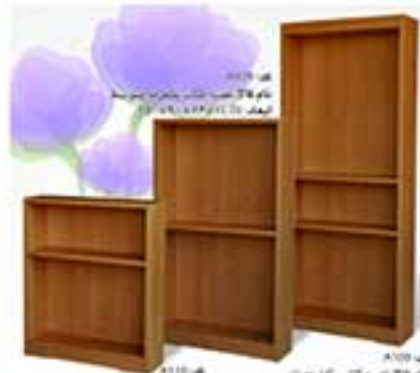
مدل A110 نام طرح کفبه و پانچر به کمره ابعاد: 120x90x40