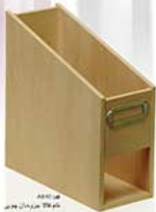
مدل ۲۵۲۶ سازماندهنده میز تحریر