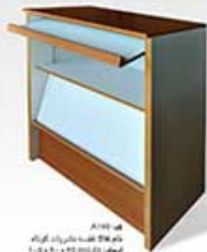
مدل A103 نام طرح کفبه و پانچر به کمره ابعاد: 120x90x40