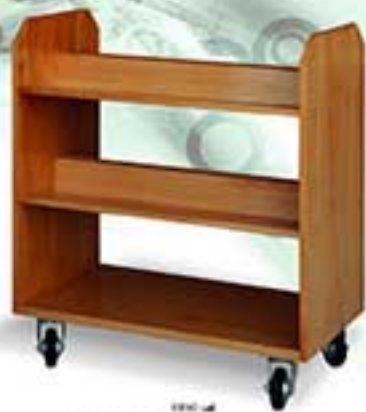
قه 0010 نام 316 لرد انوار و مین کله