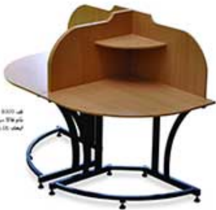
مدل 8000 نام: میز دو نفره آموزشی طرح اول ابعاد: ۱۲۰ × ۹۰ × ۹۰ (ش.رض)