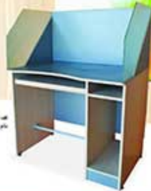
مدل 0120 ابعاد: 110 x 110 x 75