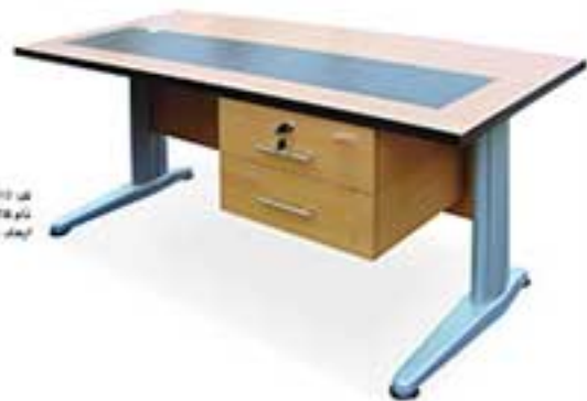
کد 0430 نام T4 میز اداری ابعاد (ش): 110 x 170 x 75