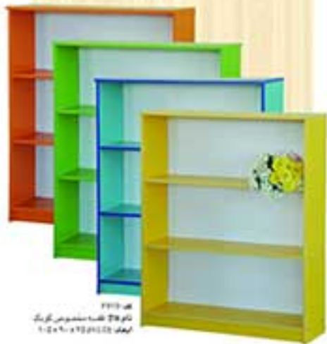
هه ۲۱۲۲ نام ۳۸ من مخصوص کونگ ارتفاع ۲۱۲ - ۹۵ x ۹۵ x ۹۵