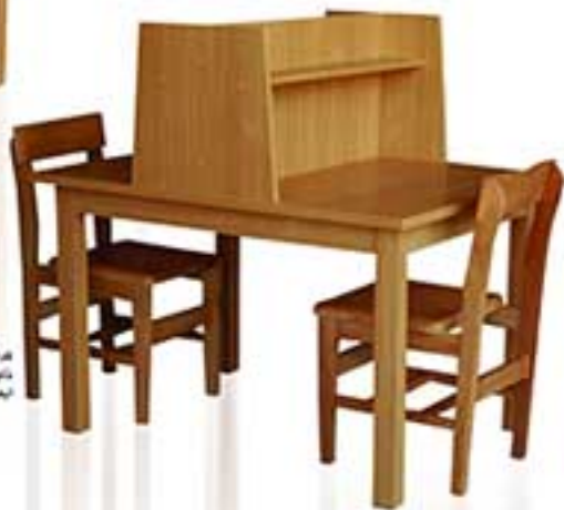
مدل 8001 نام: میز مطالعه دو نفره آموزشی طرح اول ابعاد: ۱۲۰ × ۹۰ × ۹۰ (ش.رض)