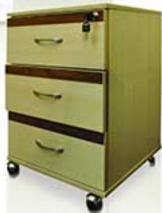
مدل 0004 نام: 4 درایه چرخدار سه کشو