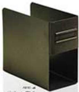
مدل ۲۵۲۱ سازماندهنده میز تحریر