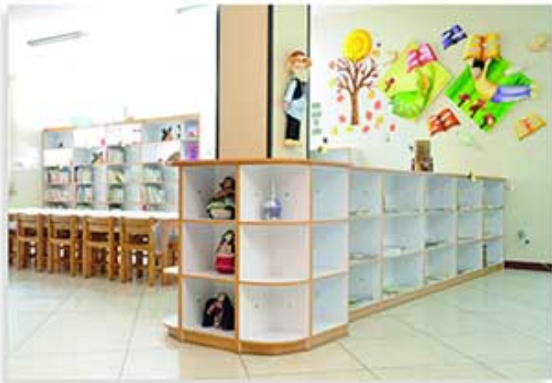
کتابخانه کودکان و نوجوانان