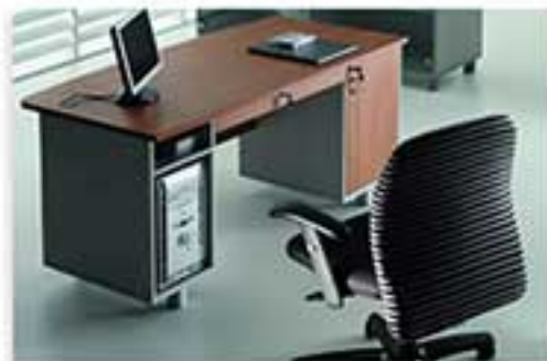
مدل 0120 ابعاد: 110 x 110 x 75