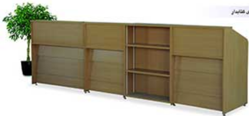
مدل 3012 ابعاد 170x70x110 سانتی‌متر