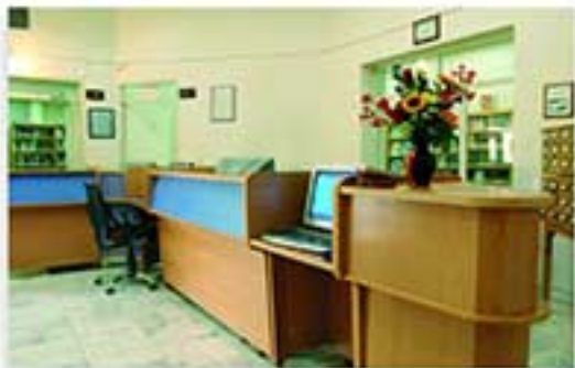
مدل 3010 ابعاد 170x70x110 سانتی‌متر کتابخانه