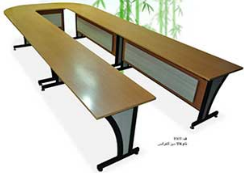
مدل ۳۱۲۰ بوم ۳۱۸ مدیر کنفرانس