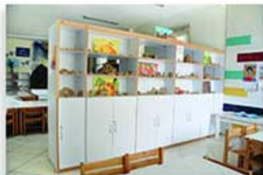
کتابخانه و بازیگاه مدرسه ابتدایی مدرسه ابتدایی