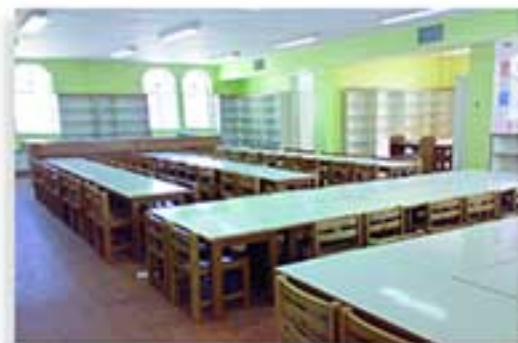
کلاس درس مدرسه ابتدایی