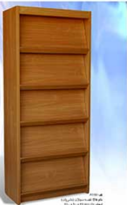
مدل A101 نام طرح کفبه و پانچر به کمره ابعاد: 210x90x40