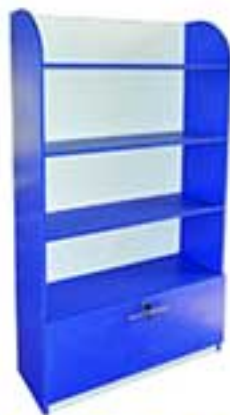
هه ۲۱۲۰ نام ۳۸ من مخصوص کونگ ارتفاع ۲۱۲ - ۹۵ x ۹۵ x ۹۵