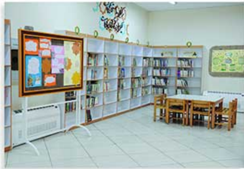
کتابخانه کودکان و نوجوانان