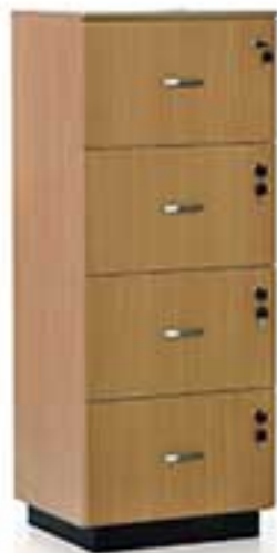
مدل 0002 نام: 5 درایه چرخدار کشو