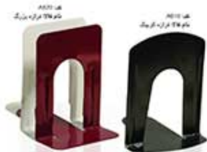
مدل ۲۵۲۳ سازماندهنده میز تحریر