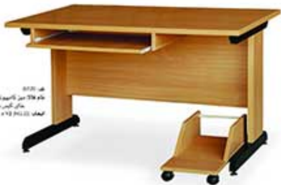
مدل 0120 ابعاد: 110 x 110 x 75 میز کامپیوتر به همراه صندلی کتبی و کابینچه