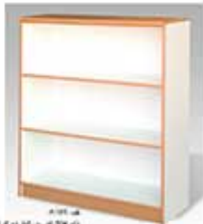
مدل A102 نام طرح کفبه و پانچر به کمره ابعاد: 120x90x40