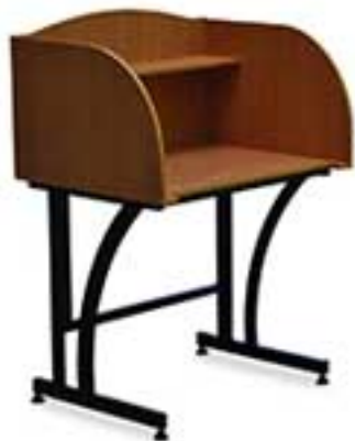
مدل 8000 نام: میز یک نفره آموزشی طرح اول ابعاد: ۹۰ × ۹۰ × ۹۰ (ش.رض)