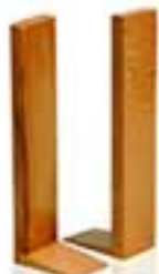
مدل ۲۵۲۵ سازماندهنده میز تحریر