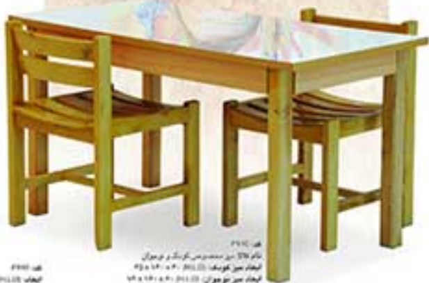
هه ۲۱۱۰ نام ۳۸ من مخصوص کونگ و چرمیان ارتفاع من کونگ ۲۱۱.۵۵ - ۲۱۰ x ۹۵ x ۹۵ ارتفاع من تو چرمیان ۲۱۱.۵۵ - ۱۹۰ x ۹۵ x ۹۵