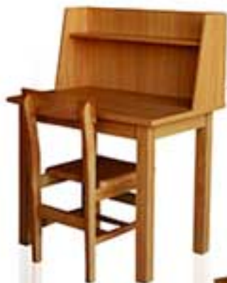
مدل 8001 نام: میز مطالعه یک نفره آموزشی طرح اول ابعاد: ۹۰ × ۹۰ × ۹۰ (ش.رض)