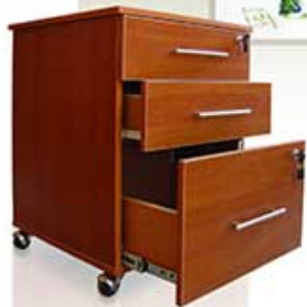
مدل 0010 نام: 3 درایه چرخدار سه کشو