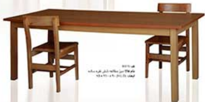
مودل 0111 طاقم 20 من سلاله جوار قمره سلاله الاجناس 130 x 130 x 45 - 2013, 20