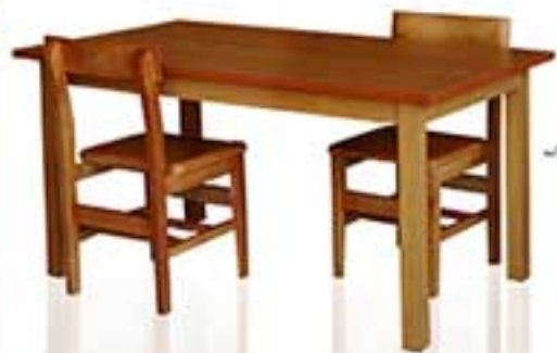
مودل 0110 طاقم 20 من سلاله جوار قمره سلاله الاجناس 130 x 130 x 45 - 2013, 20