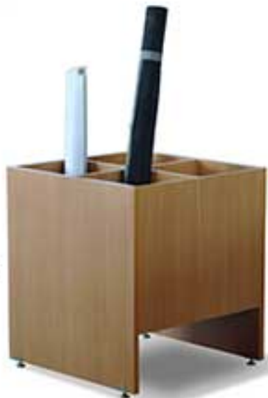
قه 0011 نام 316 مین کله