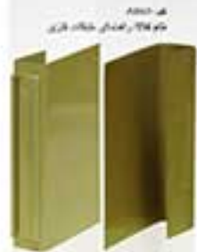
مدل ۲۵۲۲ سازماندهنده میز تحریر