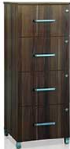
مدل 0002 نام: 5 درایه چرخدار کشو